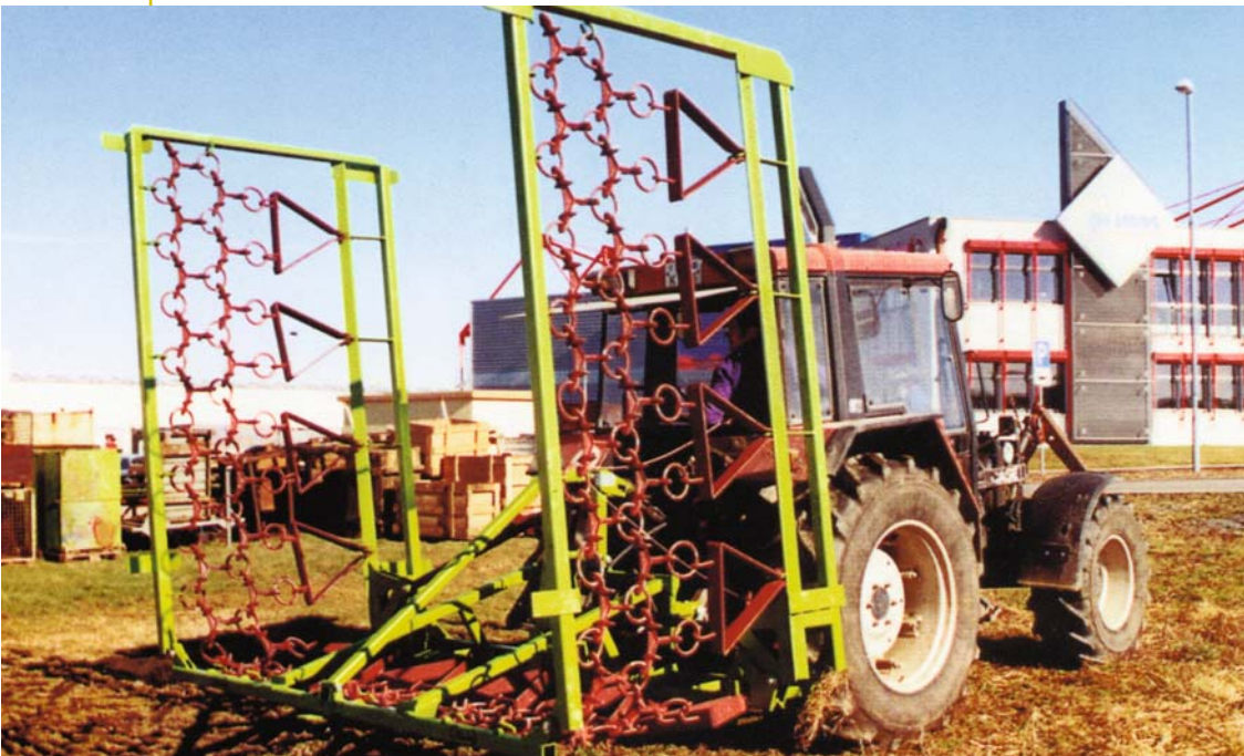
Typ Hortus mit 7,55 m Arbeitsbreite